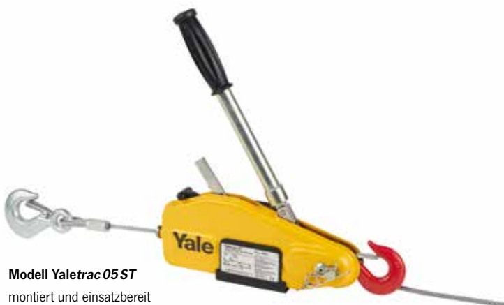
Modell Yaletrac 05 ST montiert und einsatzbereit