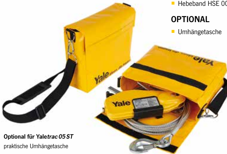
Optional für Yaletrac 05 ST praktische Umhängetasche